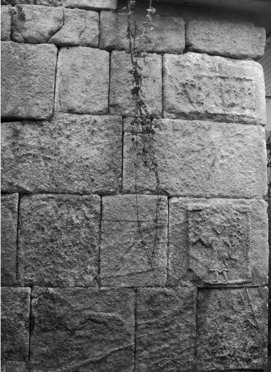
Exteriores de Santa Eulalia de Bóveda, Lugo.