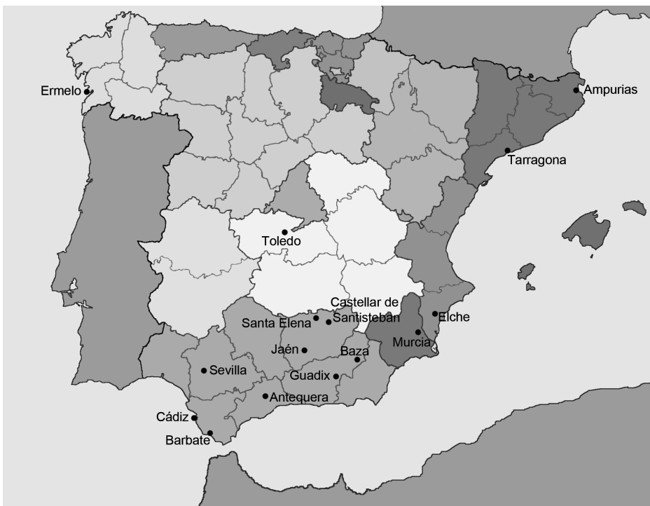
Mapa de localizaciones mencionadas en el capítulo.

Antes bien, tiempo y espacio eran para el hombre antiguo lugares predestinados. Necesariamente los héroes orientales como Hércules y Perseo debían partir de viaje para medirse con los héroes, y gigantes extranjeros. En el Occidente los esperaba el país llamado de las Hespérides o de las Islas Afortunadas, cuyo reino más antiguo se