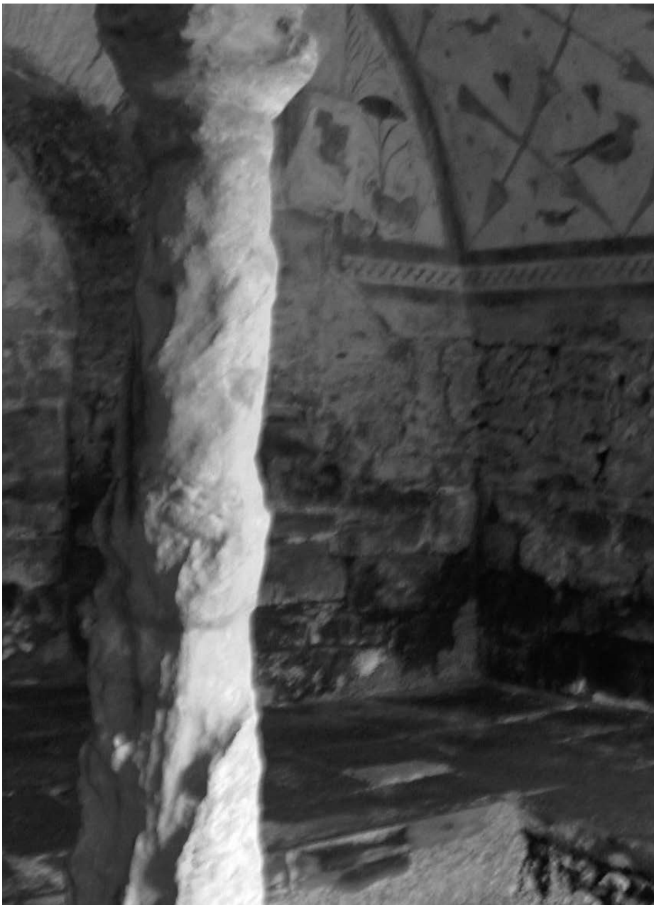
Ninfeo de Santa Eulalia de Bóveda, Lugo.