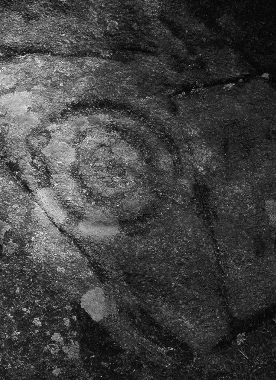
Petroglifo de Campo Lameiro, Pontevedra.