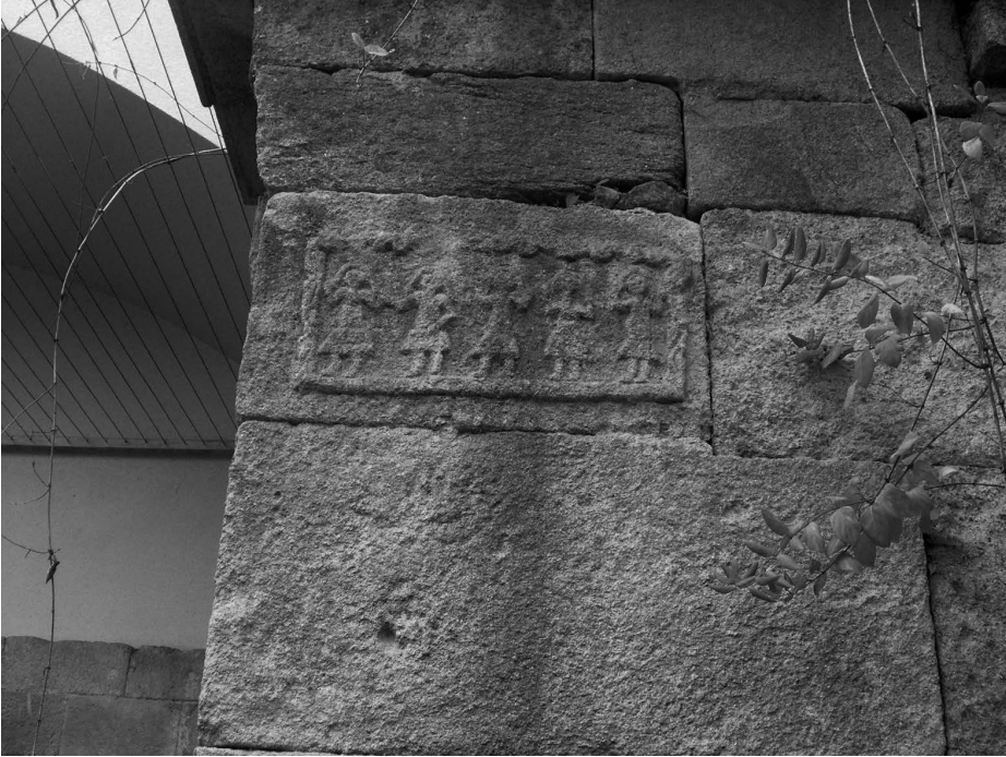
Danzantes en Santa Eulalia de Bóveda, Lugo.

de raíces zoroástricas, los euquetos, que actuaron durante siglos en los territorios del Imperio romano oriental, extendiéndose a las regiones de Tracia y Tesalia. Estos euquetos en sus reuniones comunales adoraban a Lucifer, valiéndose de un macho cabrío o bien de un gato negro o un perro 38 . Las reuniones degeneraban siempre en ritos extáticos vinculados al culto tántrico en donde las orgías contemplaban el incesto, la sodomía y otras aberraciones enraizadas en antiquísimas formas de las religiones babilonia y asiria 39 .