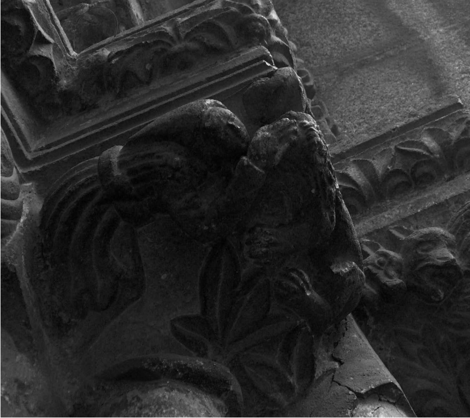
Iconografía de raíces paganas.

que el significado oculto de aquel cuadro venía a representar los equinoccios de la primavera y el otoño, épocas de renovación y del triunfo de la fecundidad 41 . Este mito pasó a Roma a través de los piratas de la Cilicia, sustituyendo los romanos el viejo mito de Mitra por el del sol y añadiendo elementos extraños a la religión mitraica.