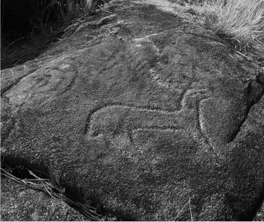
Diversos motivos zoomorfos. Campo Lameiro, Pontevedra.

Al desarrollarse los sistemas de escritura primitiva la palabra se convirtió en el vehículo natural para la ascesis. Los ritos se convierten en símbolos en movimiento. Los miembros de la cofradía egipcia de Deir el Medinneh, las hetairías, Los misterios de Eleusis, los cultos mitraicos, Vitrubio, Apuleyo, Pacomio, los cuatro coronados, los coleggia fabrorum , los maestros del Como, los colitores dei , Athelstan, Eduino, las abadías carolingias, Hirsau, los francmasones, los compañeros del Deber, la compañía de la Llana, Willermotz, Gerard de Nerval, Anthony Sayer, Desaguliers, Albert Pike y tantos otros