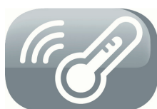
Room temperature thermistor