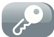
Child proof lock