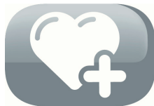
Automatic extension mode