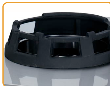
DETALLE ARO WOK