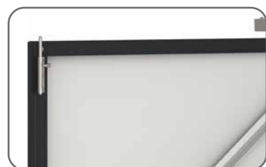
Cierre de puertas con pestillo vertical en acero

La tienda de bicicletas está hecha de metal, esta unidad de almacenamiento ofrece una excelente seguridad para las bicicletas y es una tienda segura ideal para todas sus bicicletas de montaña, de carretera y el equipo de ciclismo en general. Este cobertizo de almacenamiento de bicicletas está hecho de nuestros gruesos paneles de acero galvanizado con un suelo de metal integral y un cómodo acceso de doble puerta grande. El almacén de bicicletas está equipado con un robusto sistema de cierre de 3 puntos, ¡sin necesidad de cerraduras internas adicionales!