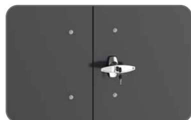
Cerradura de cierre de cilindro de acero inoxidable