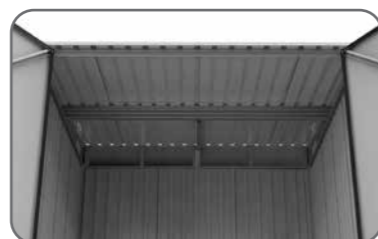
Fuerte estructura de acero del techo soporta una carga de nieve de 5,44 kgs/m 2