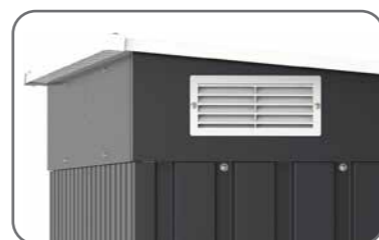
Doble sistema de ventilación laterales de aire