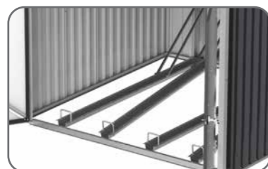
Soportes ajustables para 4 bicicletas