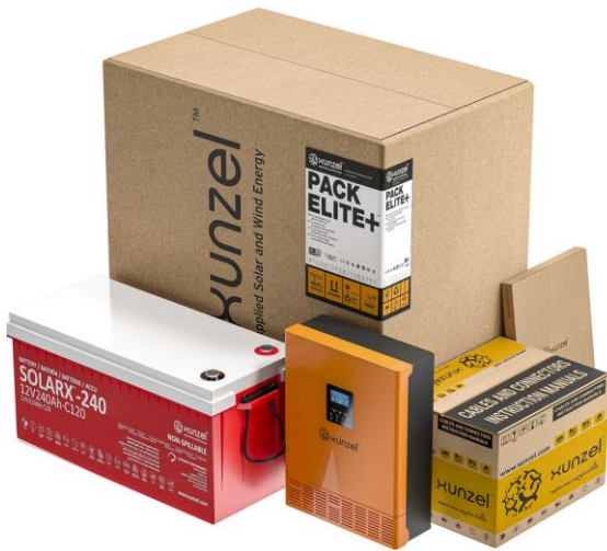
PACK ELITE+ 1000