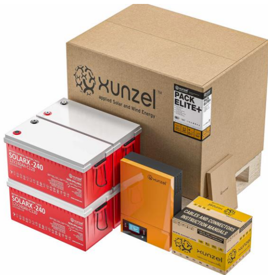
PACK ELITE+ 5000