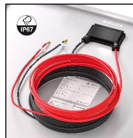
incluye 4m cable (2-cables)