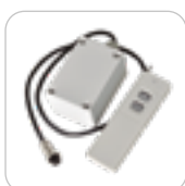
MANDO DISTANCIA RC300-3000