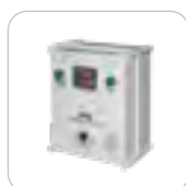
ATS BOX CUADRO COMMUTACIÓN