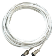
15m ATS cable de señal