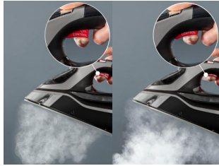
Disparador de 2 niveles de vapor