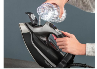
Depósito de agua de 350 ml

Salida de vapor cont. de 75 g/minuto y golpe de vapor de 300 g/minuto