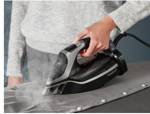
3200 W de potencia

Salida de vapor cont. de 75 g/minuto y golpe de vapor de 300 g/minuto