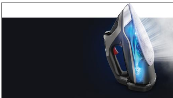
Steamforce Pro, Steam Iron, Steam Station Power, 3200 W, 75 g/minute Cont. Steam, 300 g/min. Steam Boost Plancha de vapor DW9511D1