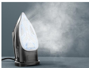
Suela con microsteam 400 HD con acabado láser