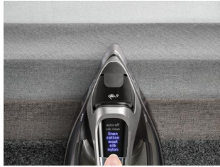
Tecnología inteligente con cinco ajustes