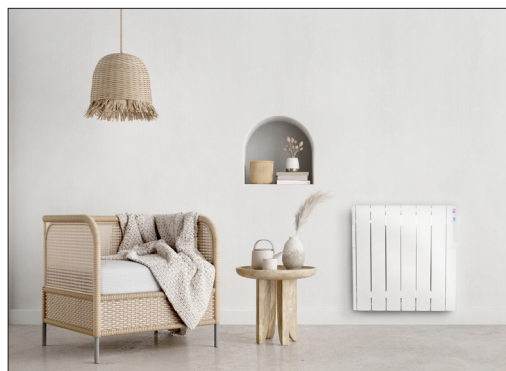
Detalle APP | Detalle USB (No incluido) | Escena ZW1000