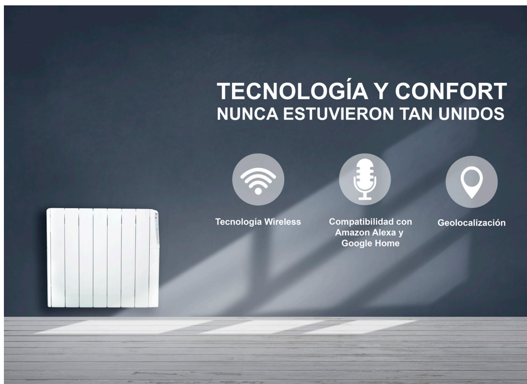
Modelo expuesto ZW1200 Blanco

EMISOR TÉRMICO FLUIDO PROGRAMABLE WIRELESS