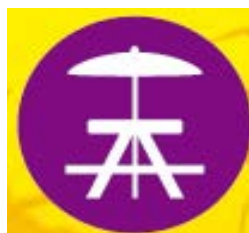
toldos y muebles de exterior