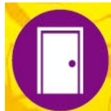
marcos de puertas y zócalos