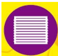
respiraderos y rejillas de ventilación