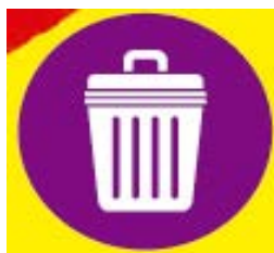
cubos de basura de exterior e interior