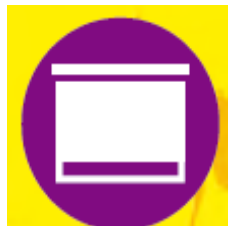
persianas y contraventanas