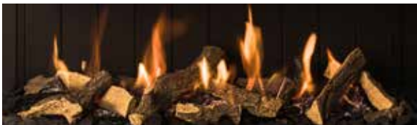
Leños cerámicos (de serie) / Ceramic logs (standard)