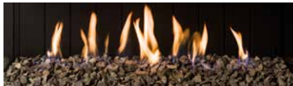
Basalto (opcional) / Basalt (optional)