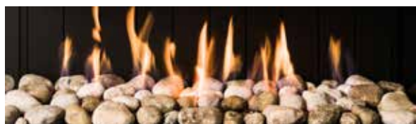
Guijarros (opcional) / Pebbles (optional)