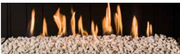
Carrara (opcional) / Carrara (optional)