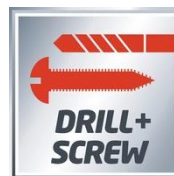
DRILL + SCREW